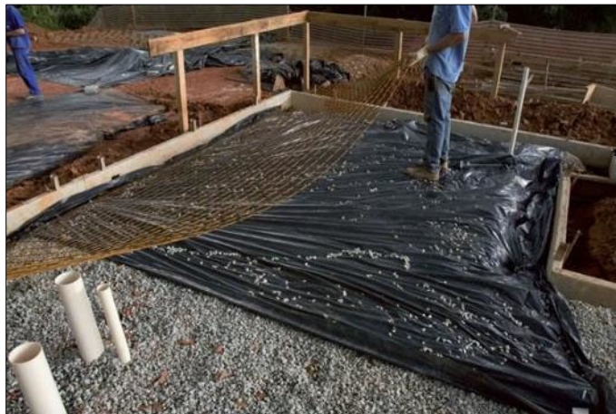
MONTAGEM DE RADIER – LASTRO DE BRITA, LONA PLÁSTICA, ARMADURA

LASTRO DE BRITA: Em todos os locais que receberão concreto, deverá ser executado o lastro de pedra brita, devidamente compactado com espessura de 5cm;