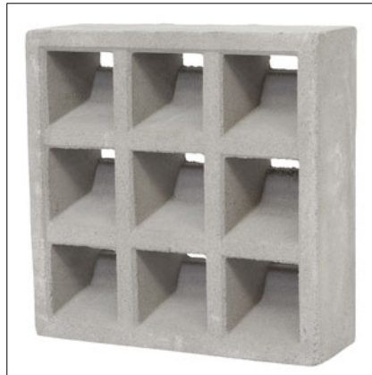
ELEMENTO VAZADO DE CONCRETO

ELEMENTOS VAZADOS: Na casa dos sopradores, serão executadas 3 aberturas com elementos vazados de concreto pré-fabricado – 39x39x10cm – 18 peças